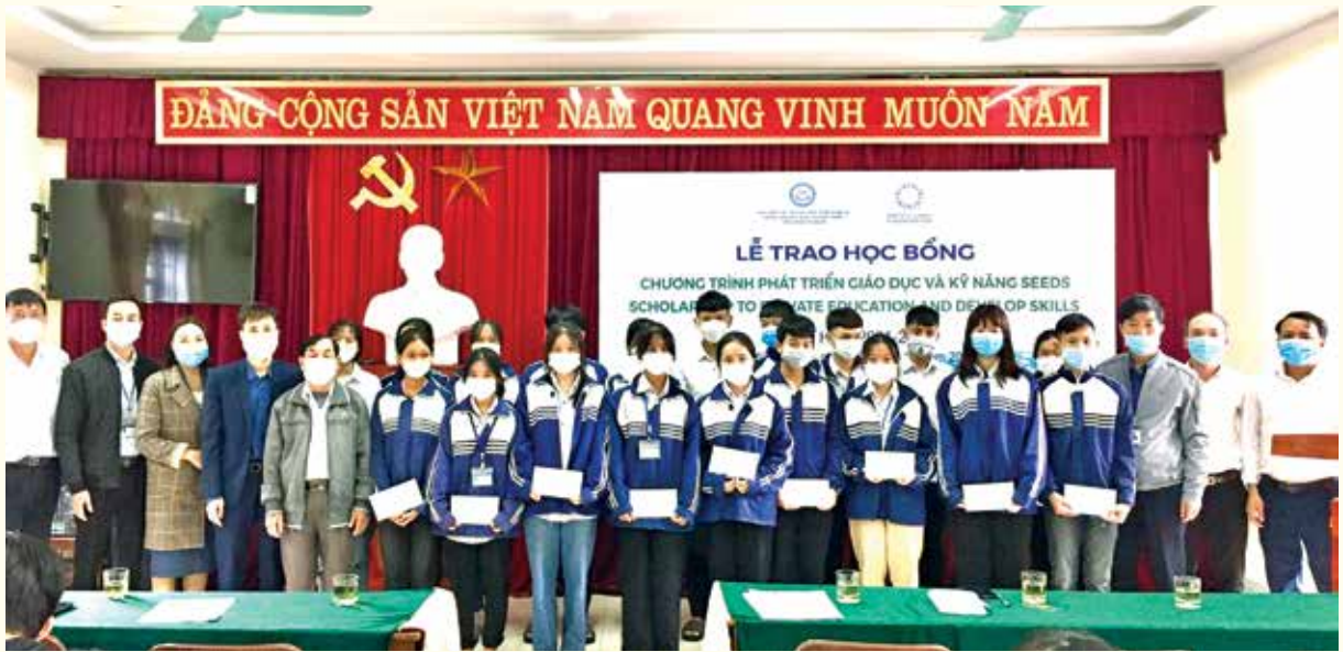
Đại diện Liên hiệp hữu nghị, Trung tâm hữu nghị phát triển cộng đồng Nghệ An trao học bổng SEEDS năm học 2021-2022 cho trường THPT Nguyễn Cảnh Chân, Thanh Chương 1, Đặng Thúc Hứa (huyện Thanh Chương) - ngày 29/10/2021

viện trợ là 898 ngàn USD, bằng 107,16% so với cùng kỳ năm 2019.