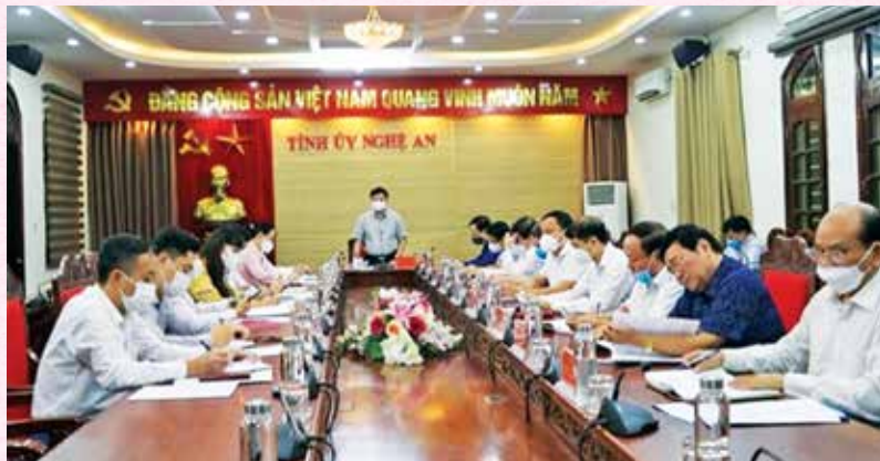
The Standing Committee of Nghe An Provincial Party Committee chaired the briefing session with the Provincial Fatherland Front and socio-political organizations (12/10/2021)

The Friendship Union has chosen the Program of External Information and Resource Exploitation, mobilizing foreign non-governmental aids to carry out online activities, such as organizing and participating in conferences, seminars,