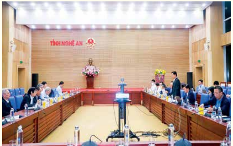
Lãnh đạo tỉnh Nghệ An làm việc với Tổ tư vấn kinh tế - xã hội tỉnh