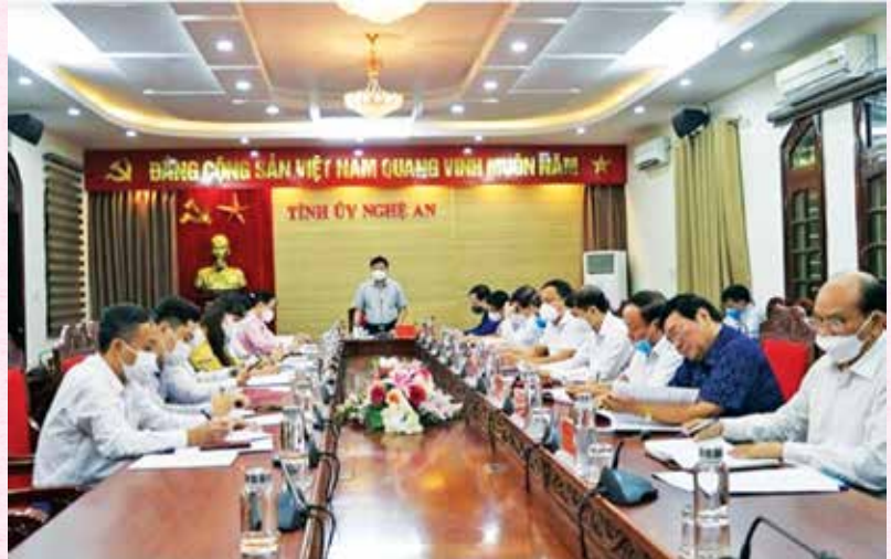
Thường trực Tỉnh ủy Nghệ An chủ trì Hội nghị giao ban với Mặt trận Tổ quốc tỉnh và các tổ chức chính trị - xã hội (12/10/2021)

Trước diễn biến phức tạp của đại dịch Covid-19, để vừa phòng, chống dịch hiệu quả vừa phát huy vai trò của tổ chức trong các lĩnh vực hoạt động đối ngoại với tinh thần “Chủ động - Linh hoạt - Sáng tạo - Hiệu quả” Liên hiệp Hữu nghị Nghệ An tiếp tục chỉ đạo và phối hợp với các tổ chức thành viên triển khai thực hiện 5 Chương trình hành động có mục tiêu do Đại hội Liên hiệp Hữu nghị lần thứ V (2019 - 2024) đề ra, đó là: Chương trình thông tin đối ngoại; Chương trình Giao lưu hữu nghị gắn