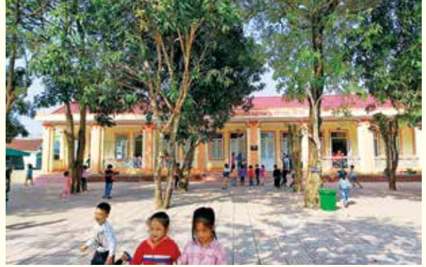
Quang cảnh 4 phòng học trường Tiểu học xã Nghi Lâm do Đại sứ quán Nhật Bản tài trợ kịp đưa vào hoạt động năm học mới 2021 - 2022

Đã và đang tiến hành khảo sát, chuẩn bị Dự án mới trình Đại sứ quán Nhật Bản vào đầu năm 2022 và phối hợp với 1 tổ chức NGO Nhật Bản vận động dự án, chương trình viện trợ nhân đạo.