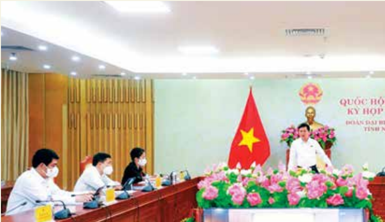
Đoàn đại biểu Quốc hội Nghệ An và các đại biểu khách mời dự phiên khai mạc Quốc hội khóa XV tại điểm cầu tỉnh Nghệ An