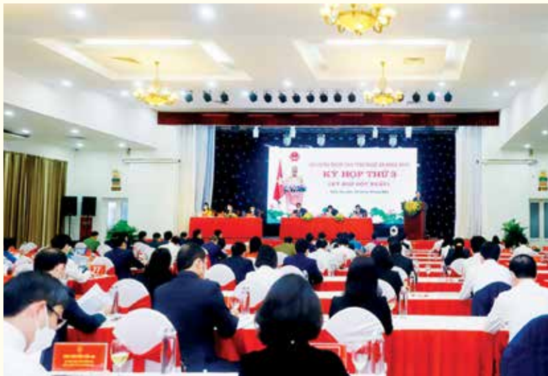
Kỳ họp thứ 3 Hội đồng nhân dân tỉnh Nghệ An khóa XVIII nhiệm kỳ 2021 - 2026