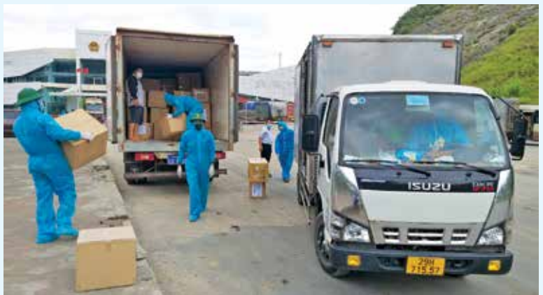
Các chiến sỹ chuyển 200.000 khẩu trang phòng, chống dịch cho Lào tại Cửa khẩu Cầu Treo

Món quà gồm 200.000 chiếc khẩu trang do Công ty Cổ phần dệt may Nam Thuận Nghệ An sản xuất và tài trợ, trị giá 2 tỷ đồng, cùng một số thiết bị y tế do Công ty