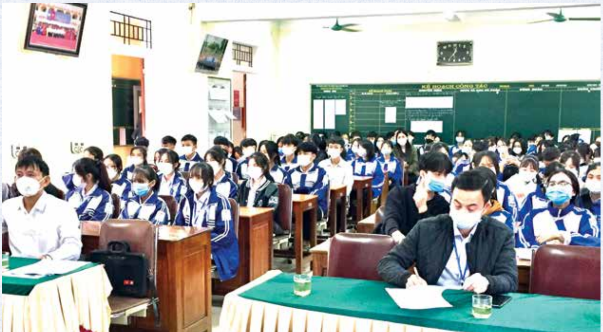
Overview of delegates and students attending the SEEDS Scholarship Award Ceremony at Nguyen Canh Chan High School, Thanh Chuong District (29/10/2021)

From 2010 to 2020 alone, in Nghe An province, there were 103 projects and 152 non-projects of nearly 100 non governmental organizations, funds and financial institutions... with a total aid of more than 21.4 million USD in the fields of