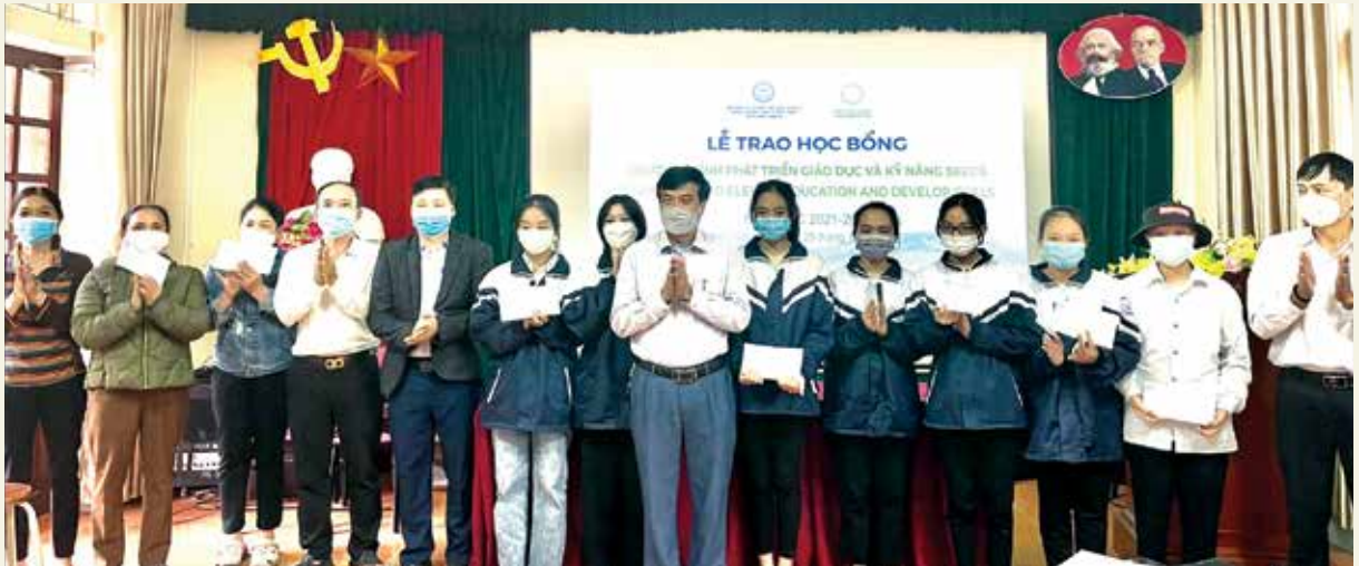
Representatives of Nghe An Friendship Center for Community Development awarded SEEDS scholarships of School Year 2021-2022 to students at Le Hong Phong, Huynh Thuc Khang high schools and the Gifted high school of Vinh University at Le Hong Phong High School - Hung Nguyen District (29/10/2021)