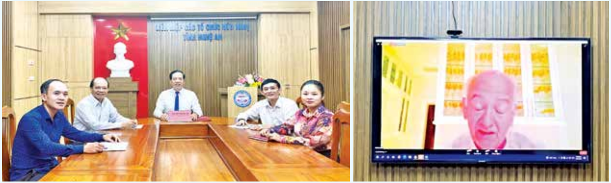
Liên hiệp các tổ chức hữu nghị tỉnh, trung tâm phát triển cộng đồng Nghệ An tham dự Hội nghị trực tuyến Lễ phát học bổng do Chương trình học bổng SEEDS - Vòng tay Thái Bình tổ chức ngày 03/10/2021

Liên hiệp Hữu nghị đã chỉ đạo và phối hợp với Trung tâm Hữu nghị phát triển cộng đồng Nghệ An (trực thuộc Liên hiệp) vận động Tổ chức Trả lại Tuổi thơ (Giving It Back to Kids) - Một tổ chức phi lợi nhuận của Hoa Kỳ, viện trợ 520 xe lăn tay cho người khuyết tật trên địa bàn tỉnh.