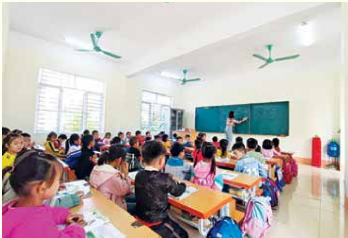
Students' class in the new classroom at Nghi Lam Commune Primary School, Nghi Loc district sponsored by the Japanese Embassy

In the complicated situation of the Covid-19 epidemic, the Vietnam - Japan Friendship Association of Nghe An province still actively conducts people-to-people diplomatic activities according to its functions and tasks and achieves some good results, specifically: