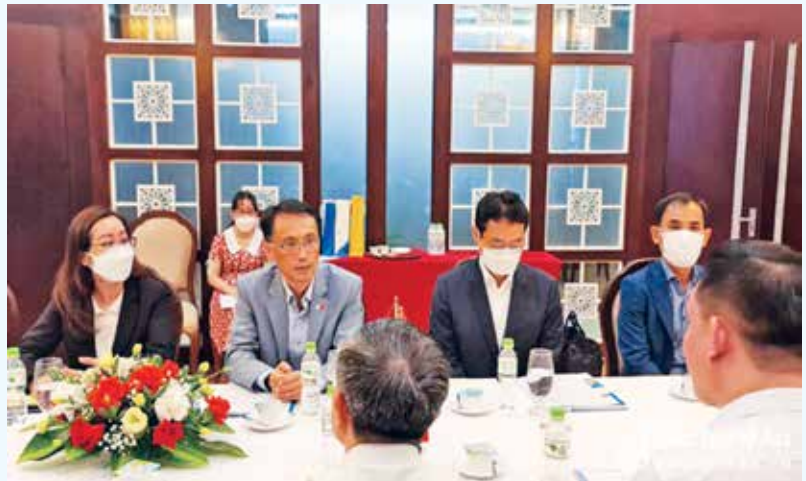
Ngài Tổng Lãnh sự Đại sứ quán Hàn Quốc phát biểu tại cuộc làm việc

Về lao động, thực hiện chương trình đưa người lao động đi làm việc tại Hàn