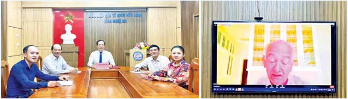
The Union of Friendship Organizations of Nghe An Province and Nghe An Friendship Center for Community Development attended the Online Scholarship award Ceremony donated by the SEEDS Scholarship Program (PALS - USA)

Development (under the Union) to request the Organization named Giving It Back to Kids - a US non-profit one, giving aid of 520 manual wheelchairs for people with disabilities in the province.