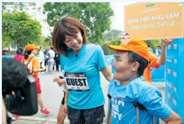
Nữ vận động viên người Nhật, Naoko Takahashi và người khuyết tật và nạn nhân chất độc da cam tại Giải Marathon TP.HCM 2018 do Quỹ hòa bình và phát triển Thành phố Hồ Chí Minh (thuộc Liên hiệp hữu nghị TP.HCM) phối hợp với Giải việt dã HCMC Run tổ chức

đạo cấp cao hai nước. Chính phủ Hoa Kỳ đã cam kết trợ giúp nhiều triệu đô la thông qua các dự án tẩy độc các khu vực bị ô nhiễm chất độc da cam/dioxin và hỗ trợ người khuyết tật Việt Nam.