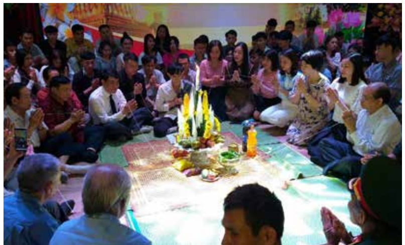
Đại diện Liên hiệp hữu nghị và Hội Hữu nghị Việt - Lào, Việt- Thái tỉnh Nghệ An tham dự Lễ buộc chỉ cổ tay nhân dịp Tết Bunpimay-CHDCND Lào tại trường ĐH SPKT Vinh