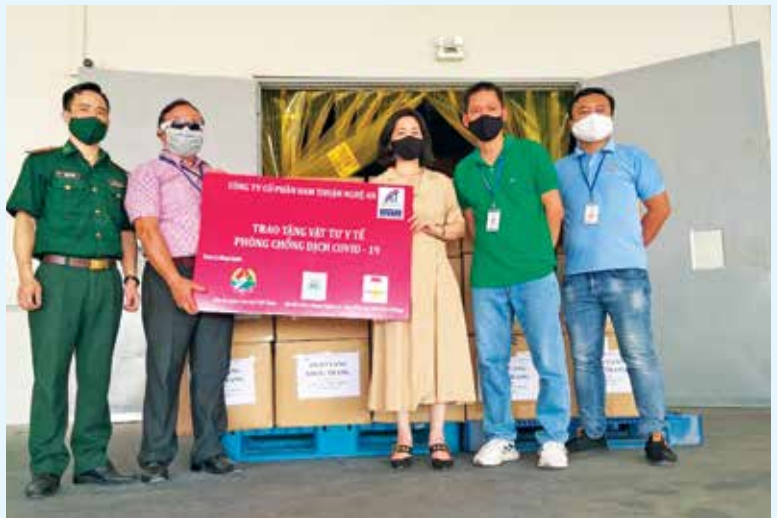
Representatives of the Vietnam - Laos Friendship Association of Nghe An and the Provincial Border Guard presented medical supplies to fight against Covid-19 to representatives of Xieng Khoang and Hua Phan provinces - Lao PDR

Committee of Vietnamese volunteers and experts to help the Lao revolution, the Vietnam - Laos Friendship Association of Nghe An province, always show the concern and goodwill, helping Laos in all circumstances, especially at a time when Laos is facing a lot of difficulties in the fight against the Covid-19 epidemic. He also said that the situation of Covid-19 epidemic in Laos is still developing very complicatedly,