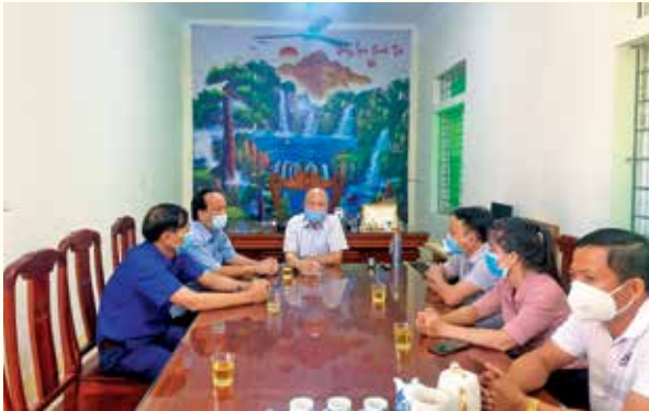
Thường trực Hội Hữu nghị Việt - Nhật tỉnh Nghệ An bàn giao 04 phòng học cho trường Tiểu học xã Nghi Lâm - Nghi Lộc - Nghệ An

T rong tình hình dịch bệnh Covid-19 diễn biến phức tạp, nhưng Hội Hữu nghị Việt - Nhật tỉnh Nghệ An vẫn tích cực tiến hành các hoạt động đối ngoại nhân dân (ĐNNĐ) theo chức năng, nhiệm vụ của Hội và đạt được một số kết quả khá, cụ thể: