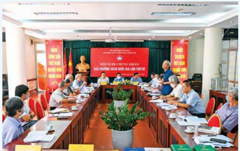
Hội nghị chung khảo Hội đồng Giải thưởng sách quốc gia lần thứ 4 tại Hà Nội (01/10/2021)

Liên hiệp Hữu nghị đã phối hợp với Hội Hữu nghị Việt - Nhật tỉnh Nghệ An thảo luận và ký kết trực tuyến với ngài Đại sứ Nhật Bản tại Việt Nam tài trợ dự án viện trợ không hoàn lại để xây dựng công trình 04 phòng học trường Tiểu học xã Nghi Lâm, huyện Nghi