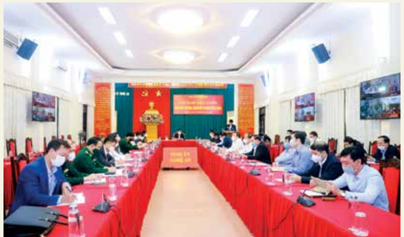
Hội nghị trực tuyến quán triệt quy định, hướng dẫn thi hành Điều lệ Đảng