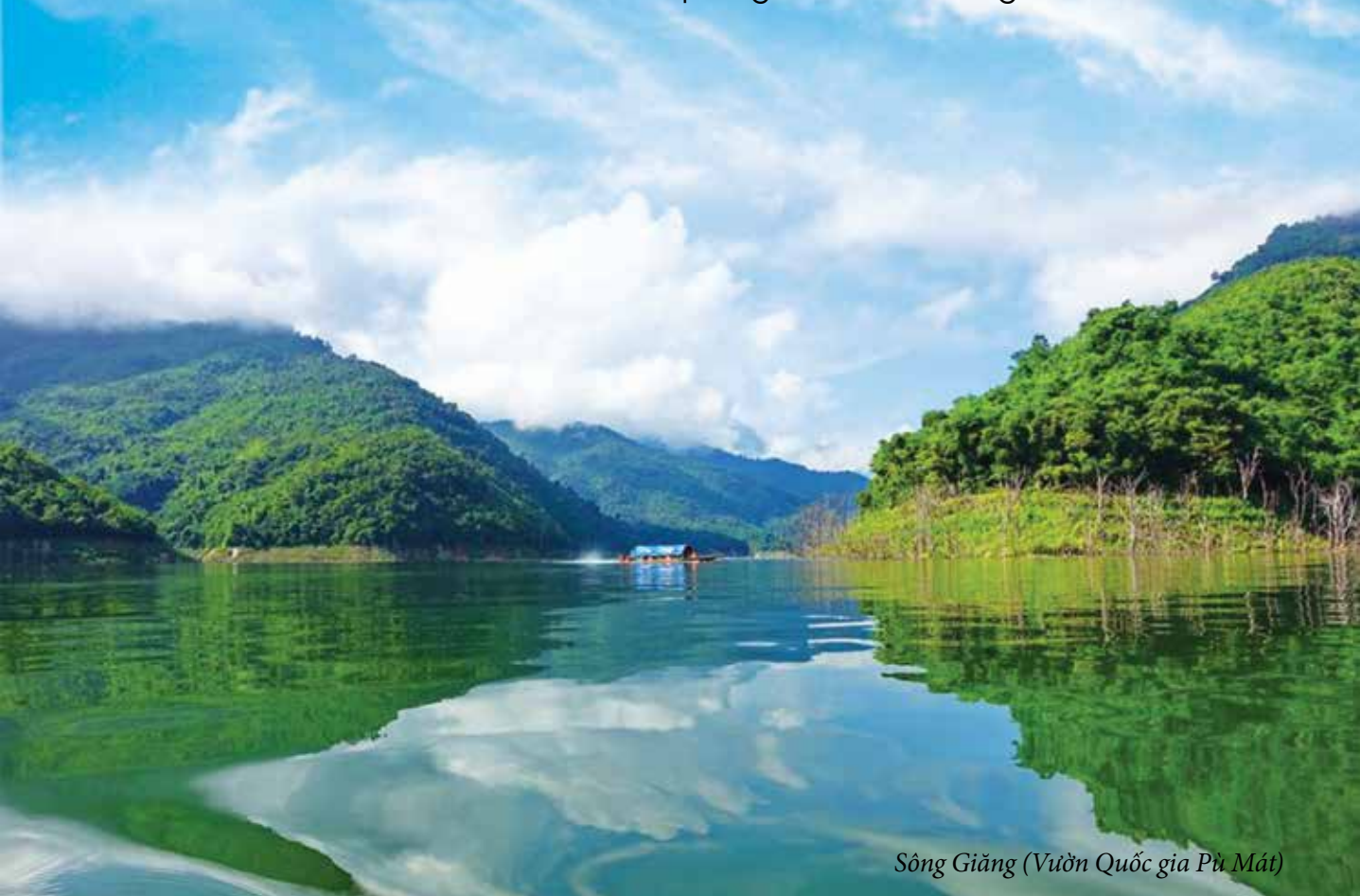
Sông Giảng (Vườn Quốc gia Pù Mát)

News Bulletin of the Union of Friendship Organizations of Nghe An Province