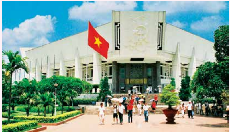
Bảo tàng Hồ Chí Minh tại Thủ đô Hà Nội Ho Chi Minh Museum in Hanoi Capital

P resident Ho Chi Minh is the great leader of the Vietnamese people, the brilliant fighter of the international communists' and workers' movement, the envoy of peace and friendship among nations, the great friend of the world people. President Ho Chi Minh has devoted all his life to the independence and freedom of the Fatherland, prosperity and happiness of the people and the typical noble values of humanity.