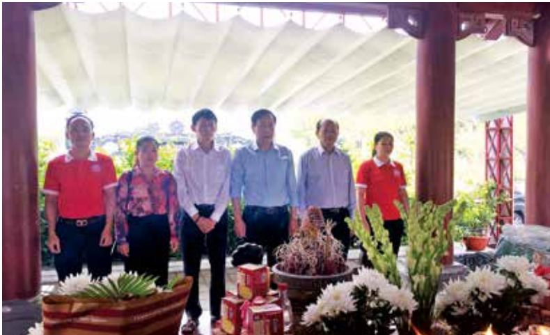
Văn phòng Liên hiệp thắp hương tưởng nhớ các Anh hùng liệt sỹ ở Khu di tích lịch sử quốc gia Trường Bồn