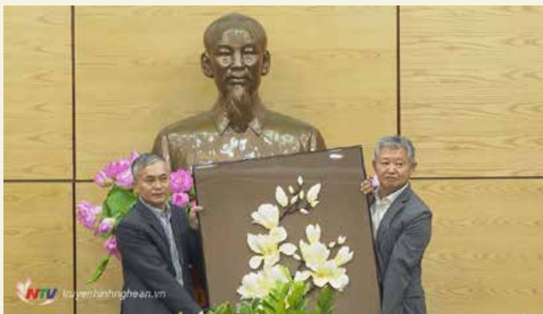
Lãnh đạo UBND tỉnh Nghệ An và Chủ tịch Hiệp hội Doanh nghiệp Hàn Quốc tại Nghệ An, Hà Tĩnh trao quà lưu niệm