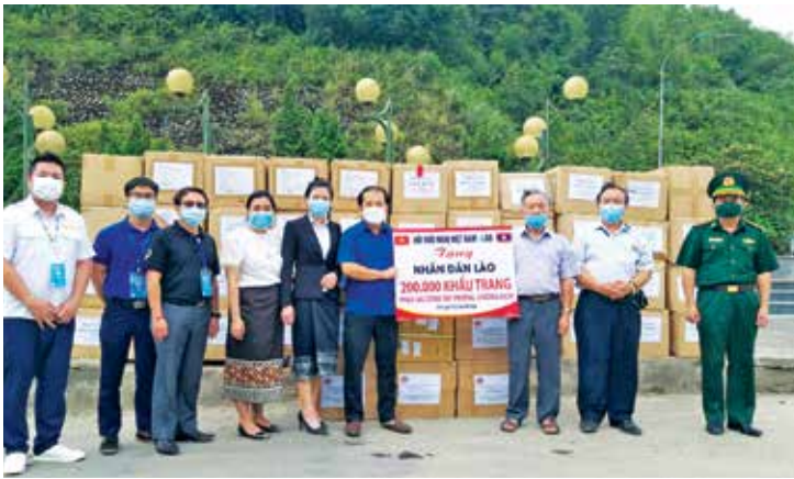
Đại diện Hội Hữu nghị Việt - Lào và Bộ Chỉ huy Biên phòng tỉnh Nghệ An trao tặng 200.000 khẩu trang cho đại diện tỉnh Xiêng Khoảng, Hủa Phăn - CHDCND Lào

M ặc dù do hoàn cảnh đại dịch Covid-19, hoạt động đối ngoại nhân dân Việt Nam - Lào tỉnh Nghệ An vẫn đạt được kết quả tốt.