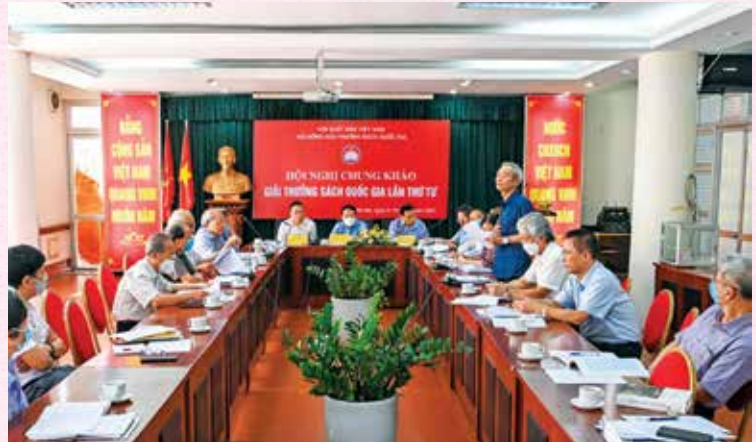
The 4th Final Conference of the National Book Award Council in Hanoi (01/10/2021)

The bright spot in the Friendship Union's people-to-people diplomacy in the context of Covid-19 prevention and control is the work of resource exploitation and foreign non-governmental aid mobilization to help the vulnerable groups in society and difficult localities of the province for the