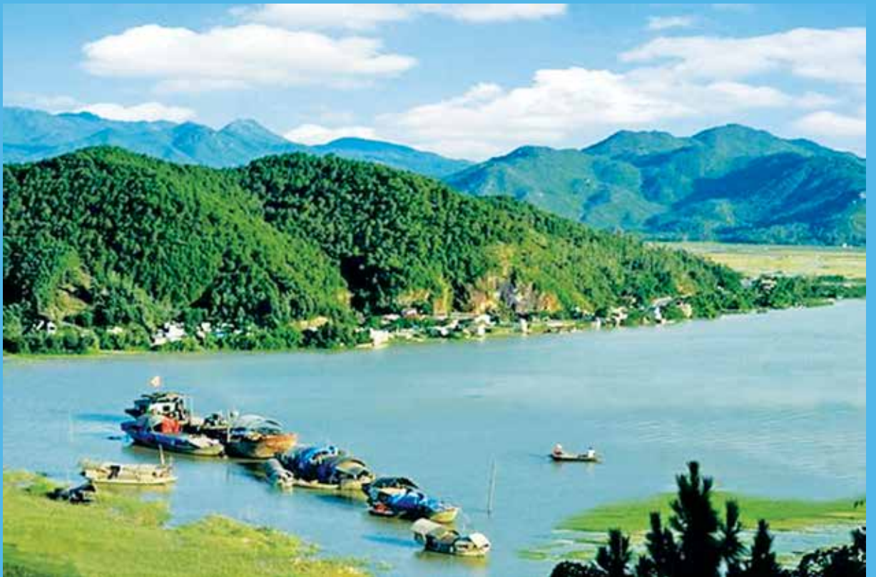
Núi Hồng- Sông Lam