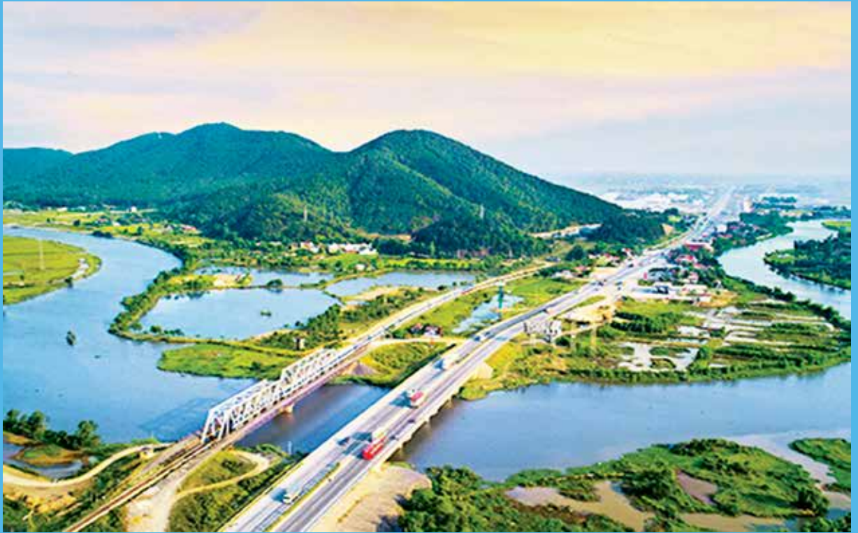
Đường vô xú nghệ