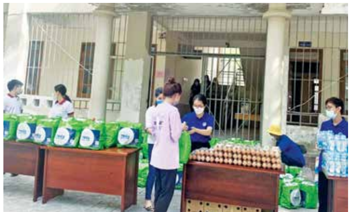
The Vietnam - Laos Friendship Association of Nghe An province offers hundreds of gifts to Lao students studying at universities and colleges in the province

Twinning Homestay program between Lao international students and the families of members of the Vietnam - Laos Friendship Association of the province in Hung Dung, Truong Thi, Hong Son, Cua Nam wards... with good results, helping Lao students to speak Vietnamese; giving vegetables, food, instant noodles for Lao students and alleviate difficulties in the anti-epidemic situation.