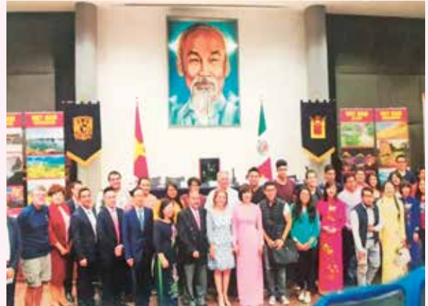
Khai trương Giảng đường Hồ Chí Minh tại Trường Đại học Mêhico (UNAM)

in the encyclopedias in the world and in the dictionaries of prominent celebrities of the 20th century, and have been praised by the whole world with the admiration and affection in the best possible way. There are the truthful, vivid and emotional films about President Ho Chi Minh produced by