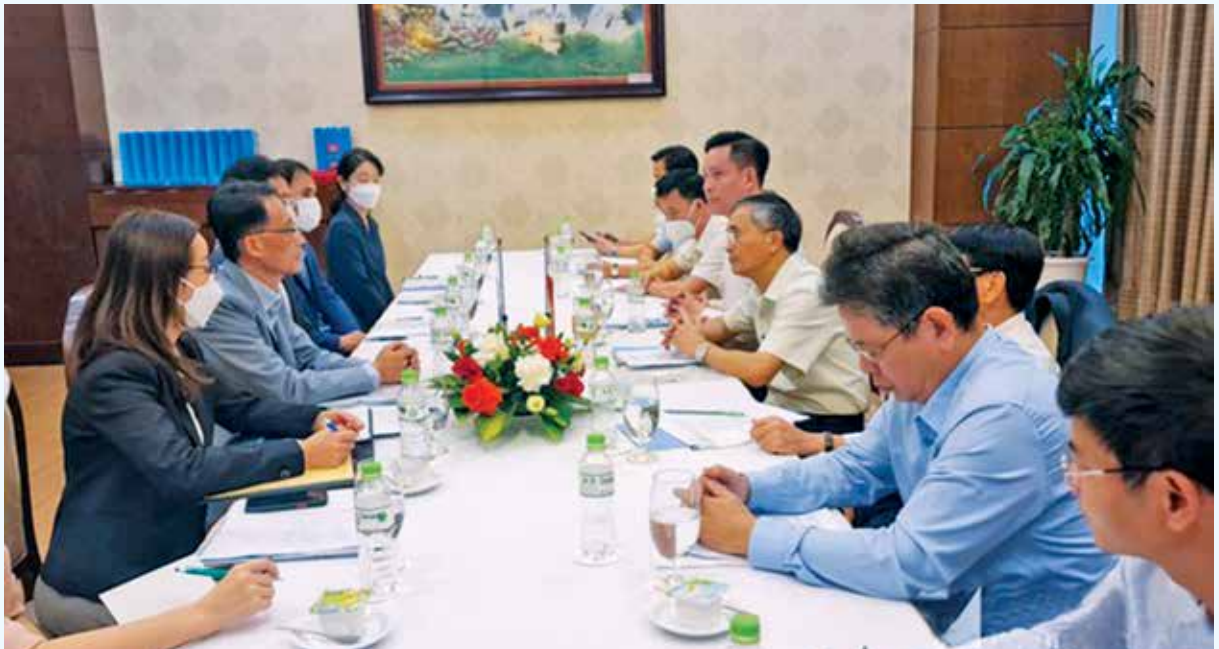
Toàn cảnh cuộc làm việc giữa đoàn công tác Đại sứ quán Hàn Quốc với UBND tỉnh Nghệ An

Về hợp tác địa phương, ở cấp tỉnh, hai tỉnh Nghệ An và Gyeonggi thiết lập quan hệ hữu nghị hợp tác từ năm 2008. Ở cấp thành phố, thành phố Vinh và thành phố Namyangju thiết