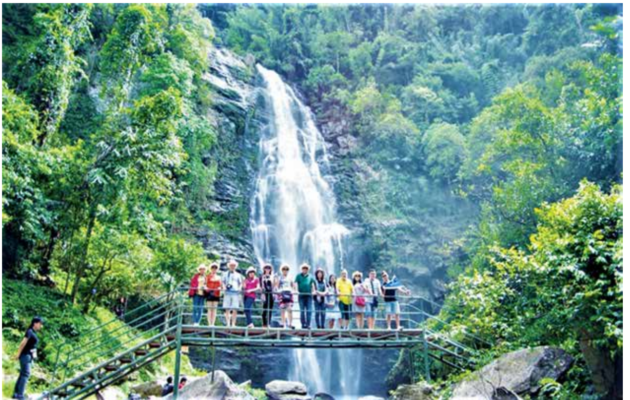
Vườn Quốc gia Pù Mát, xã Chi Khê, huyện Con Cuông, tỉnh Nghệ An