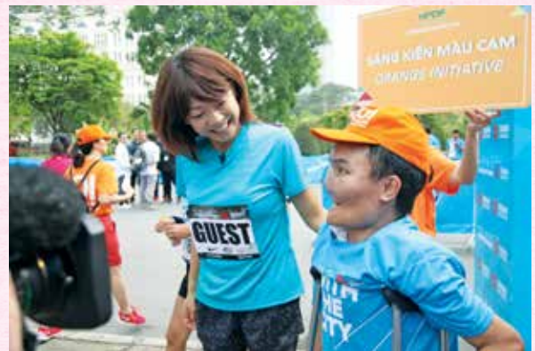
A Japanese agent orange victim took part in the 2018 Marathon Tournament in HCMC.

It will help to heal the wounds of war and thereby enhancing political trust and promoting the development of the two countries relations. Supporting agent orange also ensures the achievement of sustainable development goals, ensuring no one is left behind. It also contributes to the common efforts of the world's people to prevent the risk of chemical war, protecting peace.