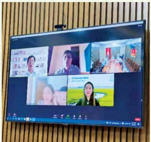
Lễ trao học bổng trực tuyến Chương trình học bổng SEEDS năm học 2021 - 2022 (01/9/2021)